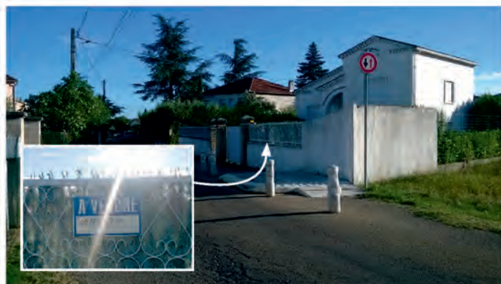
La fameuse «écluse» des Pensions, sans trottoir ni avant, ni après. En miniature : le panneau «à vendre» accroché sur la clôture de la maison située devant. Un panneau qui est là depuis un certain temps...

Autre exemple, l'entretien des abords des chemins et des ruisseaux. Chacun aura pu constater cet été les herbes hautes le long des chemins et des ruisseaux. Et quand l'entretien finit par ce faire, il se fait de la même manière que sous la municipalité précédente. C'est-à-dire selon la technique du «raisonné» qui consiste soit à espacer les passes de fauchages dans l'année, soit à laisser quelques centimètres d'herbe dans le lit du ruisseau. Cette technique soit disant écologique, conservée par la municipalité actuelle, n'est pas sans